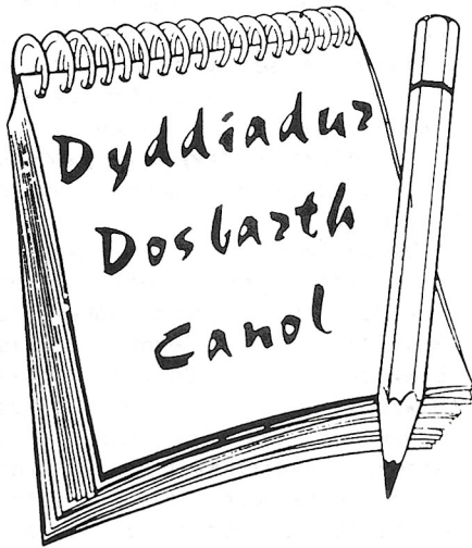
RWY'N AELOD YNG NGWAELOD-Y-GARTH

Yn ystod y degawd diwethaf dylifodd dwsinau o Yuppies Caerdydd i fyny'r afon Taf i odro'r Garth. Beth yn union yw'r atyniad mawr? Mewn cyfres o ymchwiliadau pell -gyrhaeddol bu 'Tafod Elai' yn holi pam y mae cymaint yn mynnu bod yn Garth-ion?